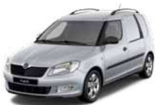
Brilliant Silver metallic