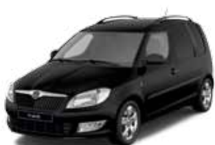
Black Magic metallic